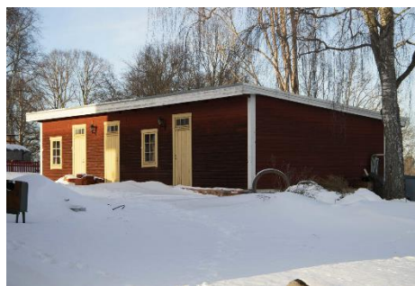
Planområdets lokalisering i Örtomta samt bebyggelsen inom fastigheten.