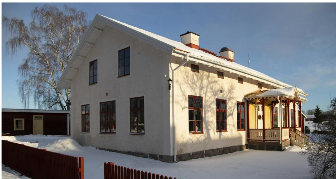
Huvudbyggnaden är en välbevarad före detta skolbyggnad.

Huvudbyggnaden inom planområdet är en kyrkskola uppförd år 1887 med en lärarbostad på övervåningen. Byggnaden nyttjas idag som privatbostad på ett tidsbegränsat bygglov. På tomten finns en äldre komplementbyggnad som används som förråd.