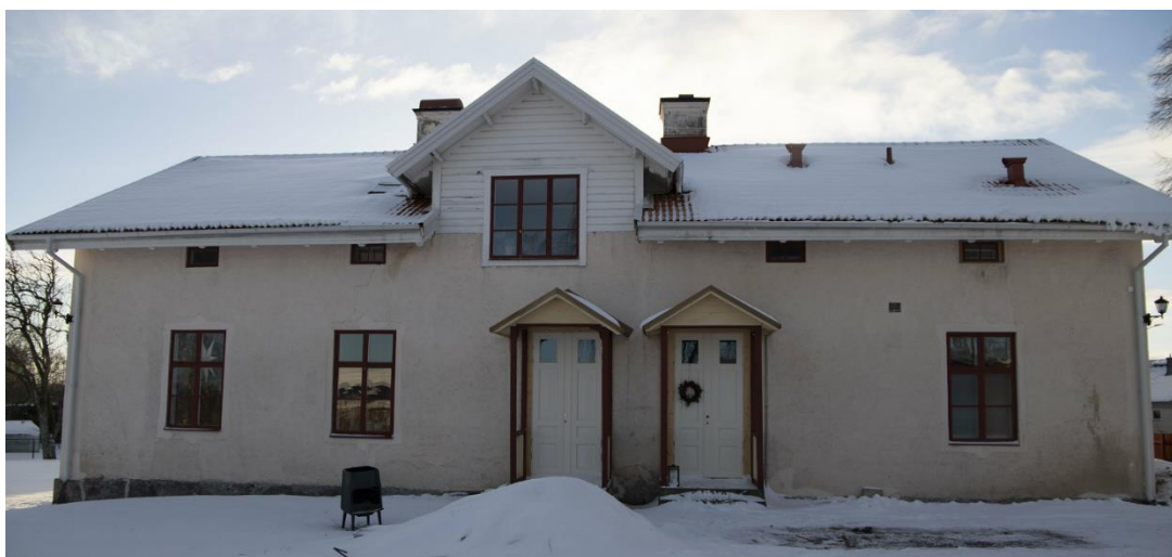
Skolbyggnaden sedd från norr. De två entréerna är bevarade.