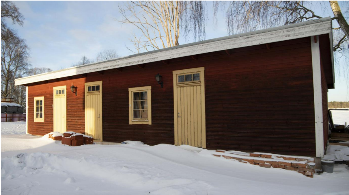
Uthuset inom fastigheten.

Bebyggelsen i Örtomta utgörs av småhus i anslutning till kyrkan. Ett klocktorn återfinns inom kyrkofastigheten i angränsning till planområdet.