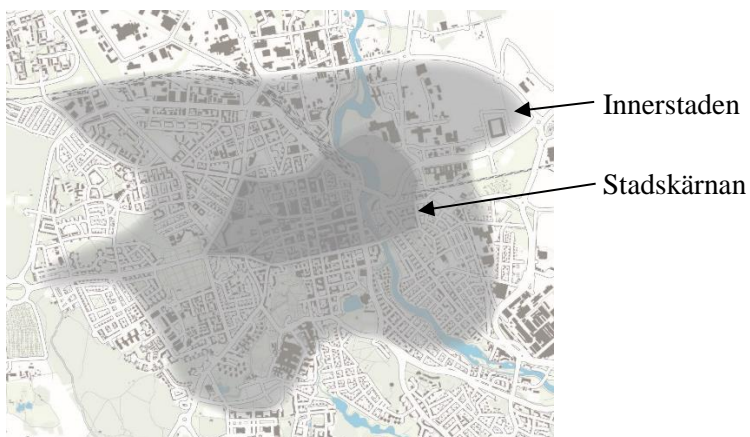
Utvidgad stadskärna och innerstad enligt Utvecklingsplan för Linköpings innerstad.