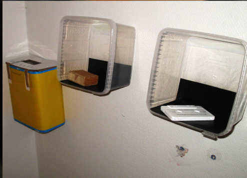
Bild 3, exempel på visuella instruktioner och planering