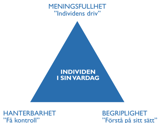
Figur KASAM Figur 3, PFA i KASAM illustration