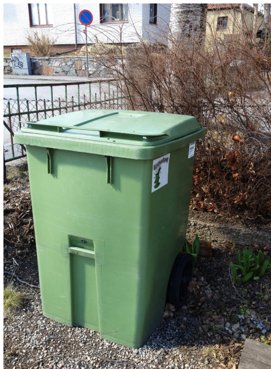
Bild 2, soptunna