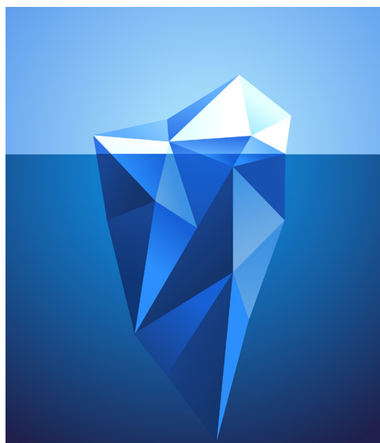
Figur 1, illustration isberg

skall det poängteras, att det är unika personer som är målgruppen, därför måste PFA anpassas till enskilda personers förmågor och svårigheter. En individ kan liknas vid ett isberg, det är bara det ovanför ytan som vi ser, det uppenbara. Att arbeta med PFA är att söka kunskap om det som finns under ytan, för det är bara en liten del som visar sig som är det uppenbara, det är bara ”toppen av ett isberg”.