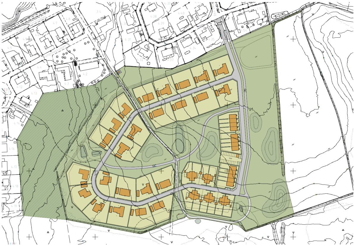
Illustration över planområdet. Källa och arkitekt: Måns Rydberg arkitektur AB, 2023-06-30.