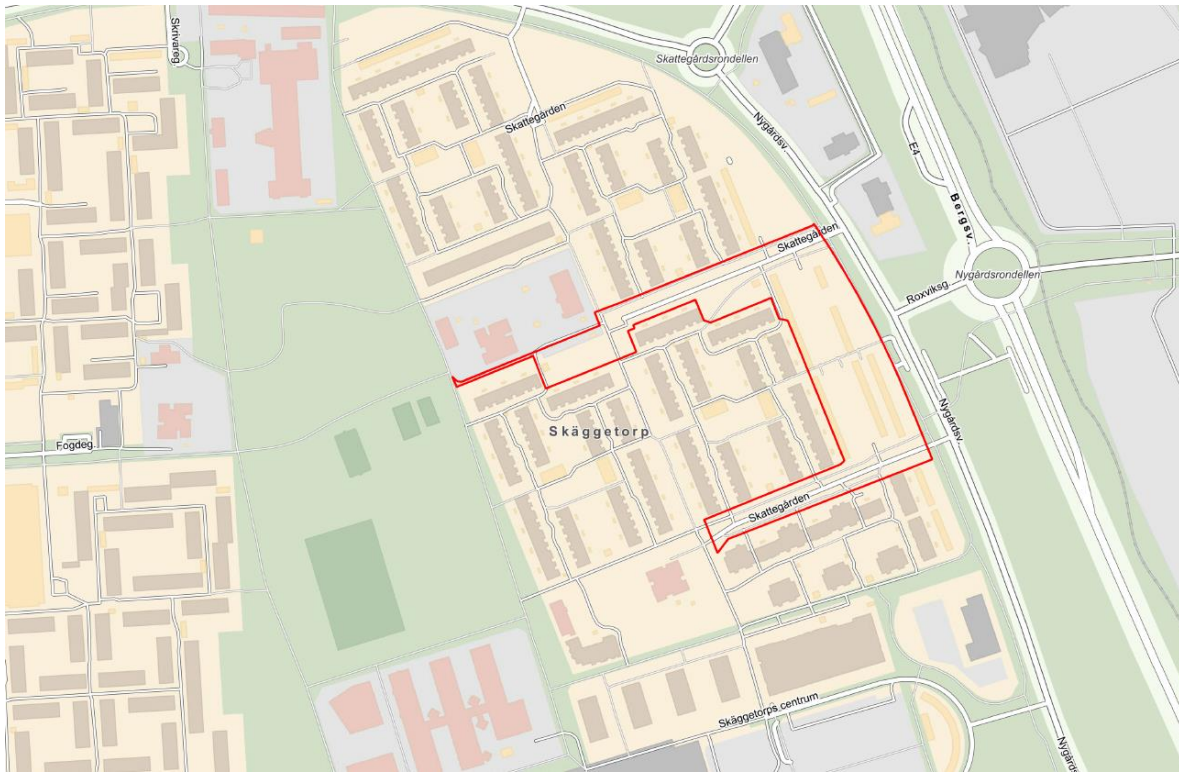
Figur 1. Preliminär avgränsning av planområdet. Avgränsning kan komma att förändras i ett senare skede.

Inom planområdet föreslås cirka 8 000 kvm BTA nybyggnad med cirka 100 nya bostäder varav 13 radhus. Två flerbostadshus i fyra våningar föreslås placeras utmed Nygårdsvägen. Söder om dessa föreslås sex radhus i två våningar uppdelat i två huskroppar. Tillsammans med ett flerbostadshus i fem våningar i norr formas ett nytt skyddat gårdsrum för de boende. I nordvästra delen av planområdet föreslås en länga med sju radhus i två våningar. Se figur 2.