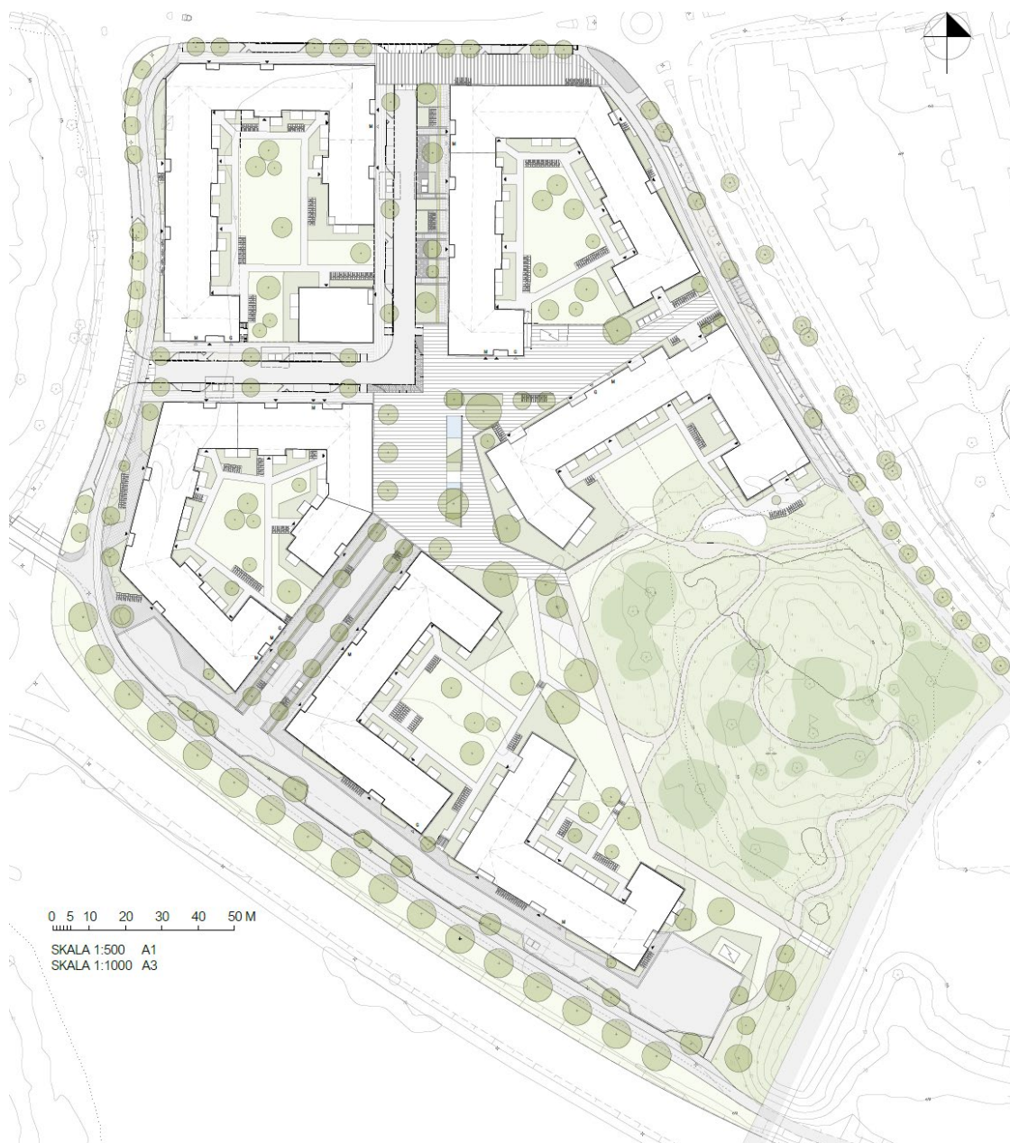
Figur 2. Illustrationsbild över tänkbar utformning av planområdet. Myllamark, 2024.

Detaljplanen föreslår en utveckling av sex stadskvarter i mellan tre och åtta våningar. Detaljplanen möjliggör för en flexibel användning av bostäder med centrumverksamhet i bottenvåning, samt möjliggör för kontor i del av planområdet, vilket gör att planområdet kan utvecklas och anpassas efter nya behov på lång sikt. Utöver detta föreslås en trädbevuxen höjd i områdets sydöstra del bevaras som naturmark. En utbyggnad av gator och infrastruktur inom området möjliggörs såväl som anpassning till omkringliggande vägnät. Se figur 2.